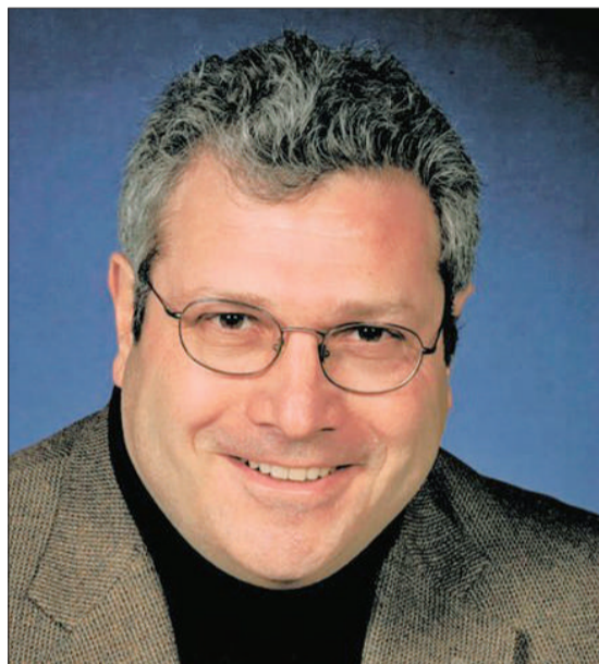
罗伯特·卡根(Robert Kagan),美国著名智库布鲁金斯学会(Brookings Institution)高级研究员,新保守主义派代表人物。

美国总统奥巴马和共和党最热门候选人罗姆尼之间至少有一个共同点,那就是他们都读罗伯特·卡根的书。卡根曾担任麦凯恩的外交政策顾问,现在在罗姆尼竞选团队中继续担任外交政策顾问。