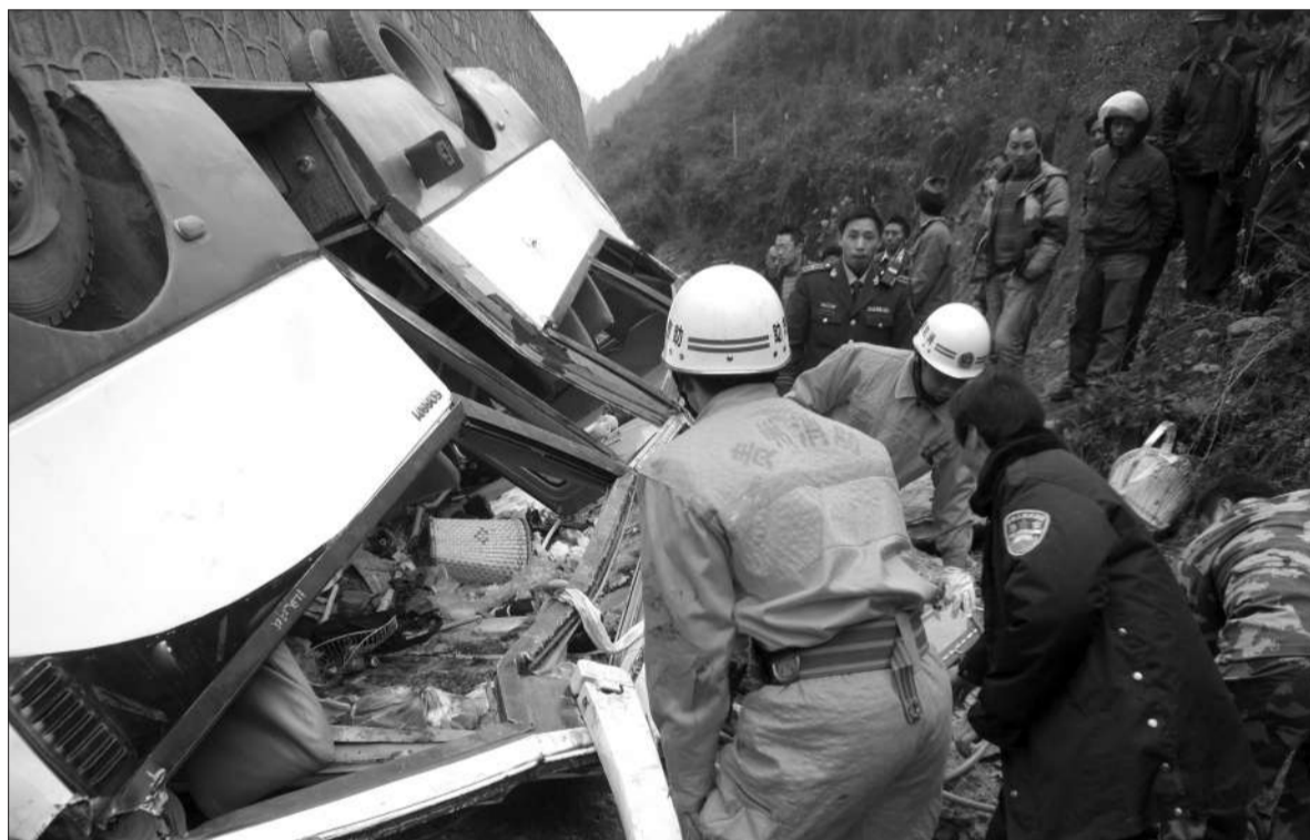
昨日,救援人员正在紧张营救被困人员。