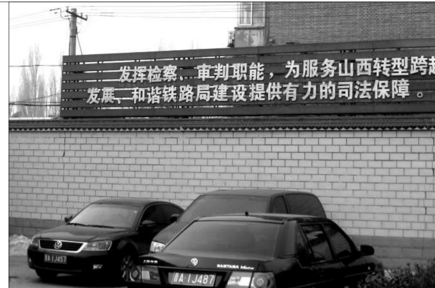
太原铁路检察院内。铁路司法不独立常被诟病,有保护铁路企业之嫌。