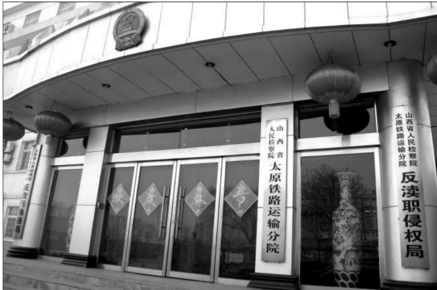
改制后,太原铁路局的文件不再向太原铁路检察院下发,今后和路局工作如何衔接成为问题。

1983年 <<<< 法院、检察院组织法修改,考虑铁路系统要改制为企业,删除铁路运输法院(检察院)作为专门法院(检察院)的规定。