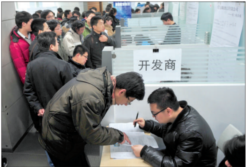
一名求职者在与其开发商招聘负责人交流。