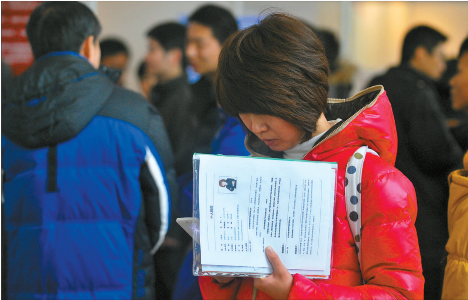
在2月5日的农展人才招聘会上,现场拿着简历的求职者。当日求职者达到了四五千人。

北京市人社局有关负责人也介绍,春节过后至2月14日,人才服务中心共主办招聘会35场,参会单位2448家,参会求职个人3万余人。其中,在北京人才市场雍和官桥分部、海淀分部举办定期人才招聘会33场,参会单位2173家,参会求职个人2.5万余人;在中国国际科技会展中心举办2012年“北京人才大市场”系列专场招聘会2场,参会单位267家,参会求职个人5000余人。