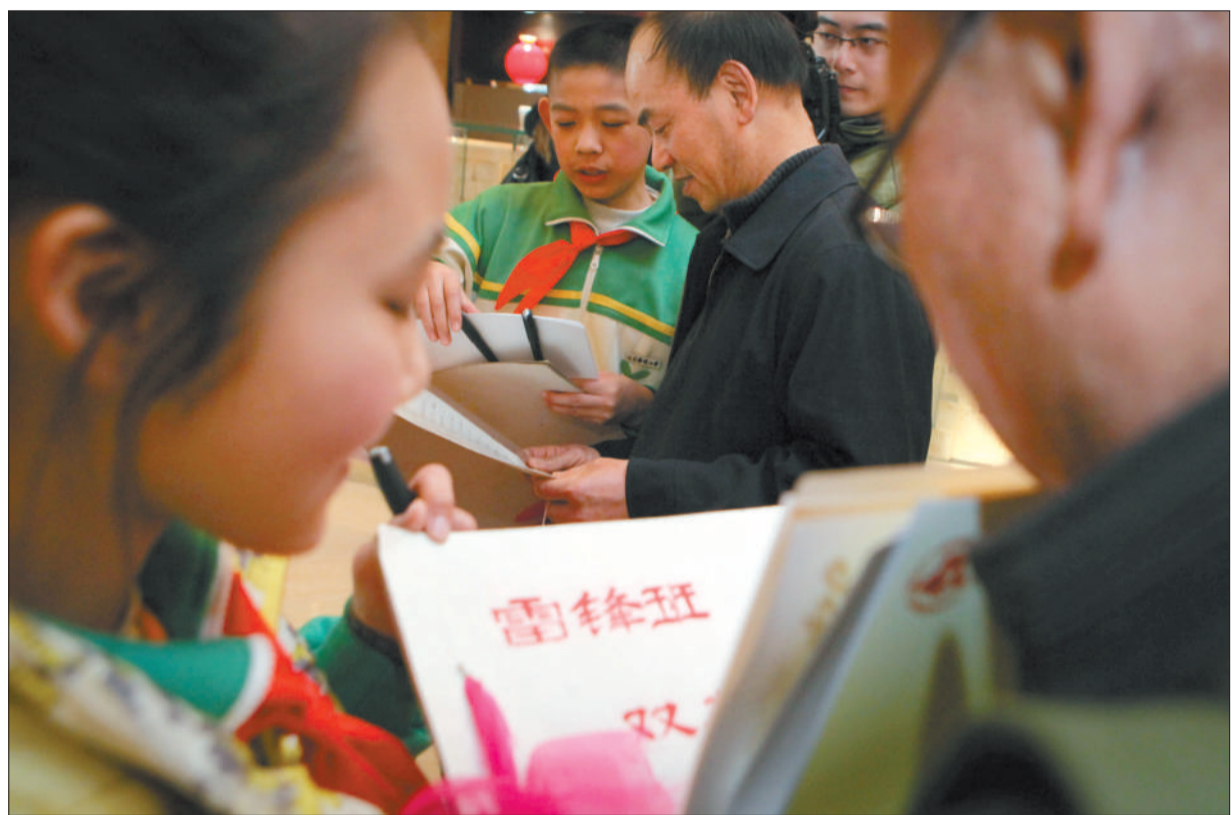
昨日,北京雷锋小学给孩子们看一些学校与雷锋班往来的历史资料。