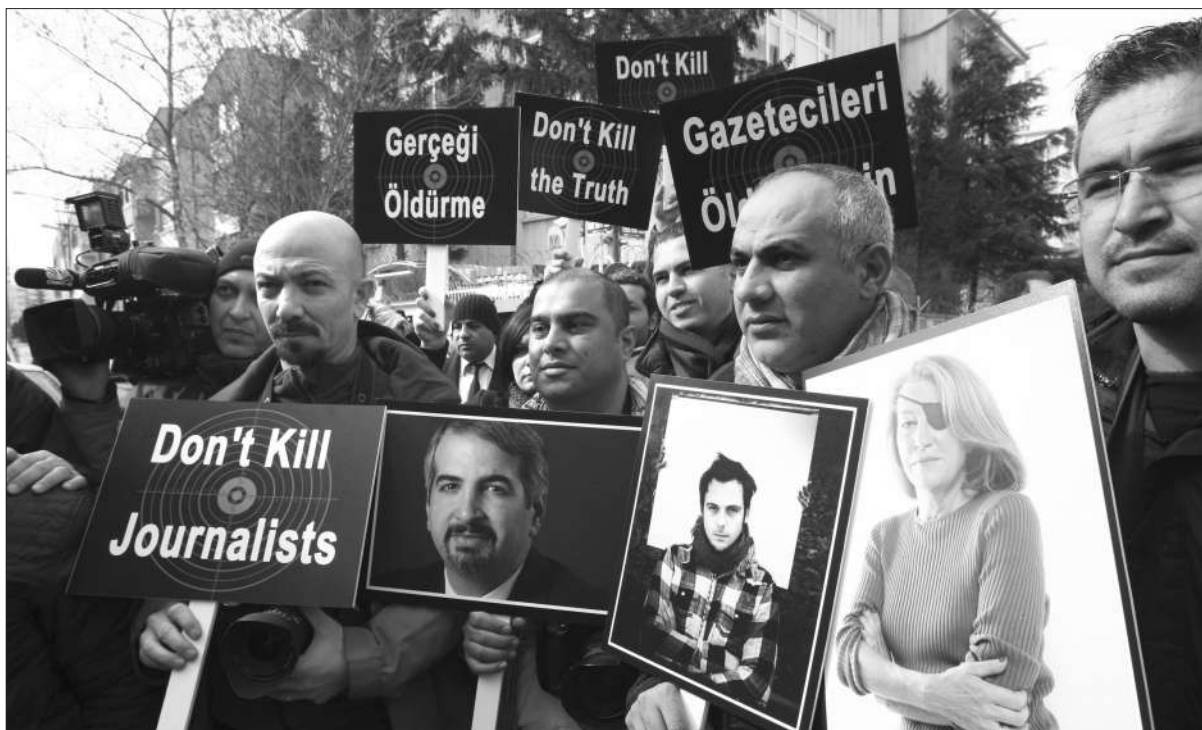
24日，土耳其安卡拉，记者举行集会，抗议两名西方记者22日在叙利亚冲突中遇袭身亡。