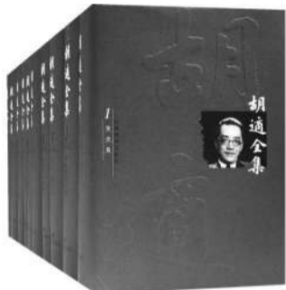
《胡适全集》(全四十四卷、共三箱)(季羨林主编),安徽教育出版社,2003年版

2月24日，是新文化运动领袖人物胡适逝世50周年纪念日。在近代中国，胡适无论是在文化、思想和学术领域，还是在社会的多个层面，均产生过巨大影响。就胡适产生影响力的具体原因，本报记者专访了社科院学部委员、胡适研究会会长耿云志先生。