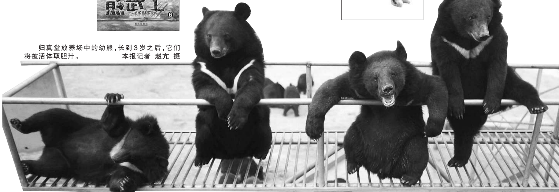
归真堂放养场中的幼熊,长到3岁之后,它们将被活体取胆汁。

西西 与前述书籍不同,这里的熊不是真熊,而是手工玩具熊。香港著名女作家西西的《缝熊志》是一本极具创意的奇书。作者多年来以写作知名,这次转而做熊,亲手缝制各种各样的毛熊。不单做熊,还为毛熊书写,其中中国古代人物服饰熊、水游英雄、花木兰等,既为毛熊缝做中国各朝的衣饰,又通过文学的语言,以优美散文描绘古典人物,并细致地阐述服饰的变化。