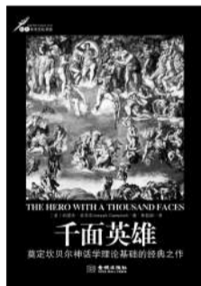
《千面英雄》 作者:约瑟夫·坎贝尔 版本:金城出版社 2012年2月版 定价:45.00元