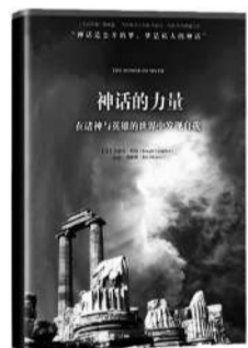
《神话的力量》 作者:约瑟夫·坎贝尔 版本:万卷出版公司 2011年9月版 定价:49.80元

如同神话中所描述的那样,人会找到数千年走来的路。在这一刻,个人在神话与梦境中永生。