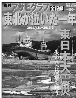
日本《朝日周刊》 哭泣东北

阴沉的天空、美以的导弹、夸张的“核弹”、深埋于地的核能……最新一期的《经济学人》把最近的伊朗核危机渲染得“风雨欲来”。但封面报道对这样的情景说不——为什么袭击伊朗不能根除核武威胁。