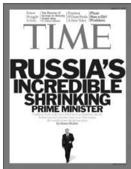
美国《时代》 普京之变

下个月日本将迎来“3·11大地震”周年祭，日本媒体也纷纷推出纪念特刊，《朝日周刊》推出增刊——“日本东北部、哭泣的一年”，走访日本地震和海啸重点灾区，记录这些地方近一年来的变化。