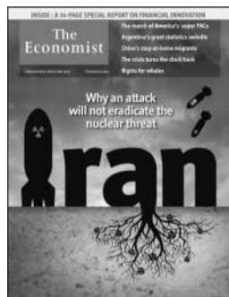
英国《经济学人》 伊朗核局

阴沉的天空、美以的导弹、夸张的“核弹”、深埋于地的核能……最新一期的《经济学人》把最近的伊朗核危机渲染得“风雨欲来”。但封面报道对这样的情景说不——为什么袭击伊朗不能根除核武威胁。