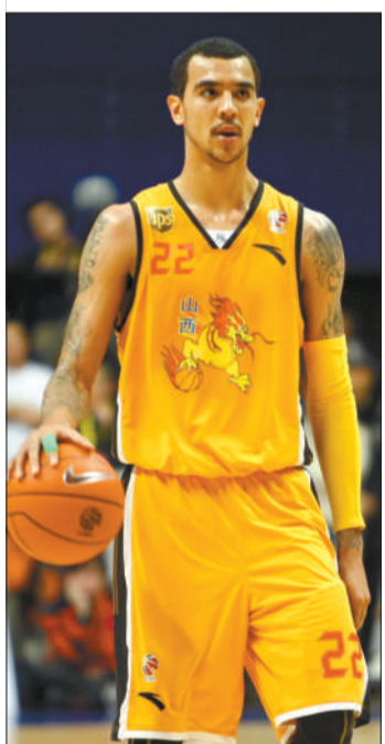
查尔斯庆祝山西队晋级,能否抑制他和威廉姆斯(小图)的发挥,将决定北京队能否叩开总决赛大门。