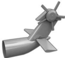
隐形直升机的尾翼细节图