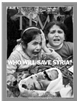
美国《时代周刊》谁拯救叙利亚

本期封面为“谁来拯救叙利亚？”文章称，随着呼吁援助的叙利亚平民数量增加，有关美国领导的军事干涉的争议正在加剧，联合国的数据显示，目前已有近8000人死亡，这一数字是北约介入利比亚时的5倍之多。