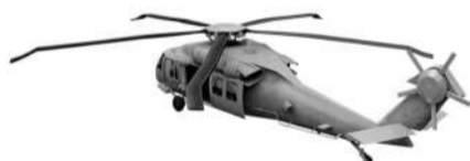
隐形直升机的侧面图