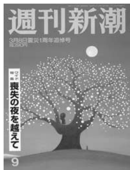
日本《新潮周刊》地震周年祭

本期英国《新政治家》关注的也是普京。作为总统大选的最可能的胜利者，普京或许将实现执掌俄罗斯20年的夙愿。从这个角度来说，他就像俄罗斯步入完全民主进程前的最后一个沙皇，在他面前，新的俄罗斯正在觉醒。