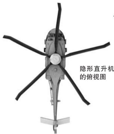
隐形直升机的俯视图