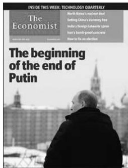
英国《经济学人》普京谢幕开始

本期封面为“谁来拯救叙利亚？”文章称，随着呼吁援助的叙利亚平民数量增加，有关美国领导的军事干涉的争议正在加剧，联合国的数据显示，目前已有近8000人死亡，这一数字是北约介入利比亚时的5倍之多。