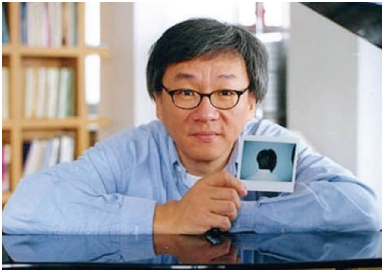
电影大师杨德昌在大陆文青中很有影响,但没有像李安、侯孝贤那样广为人知,2007年故去时诸多媒体强调了他作为蔡琴前夫的身份。