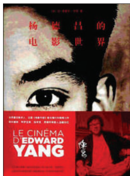
《杨德昌的电影世界》 作者:让-米歇尔·付东 商务印书馆 2012年2月 定价:48.00元