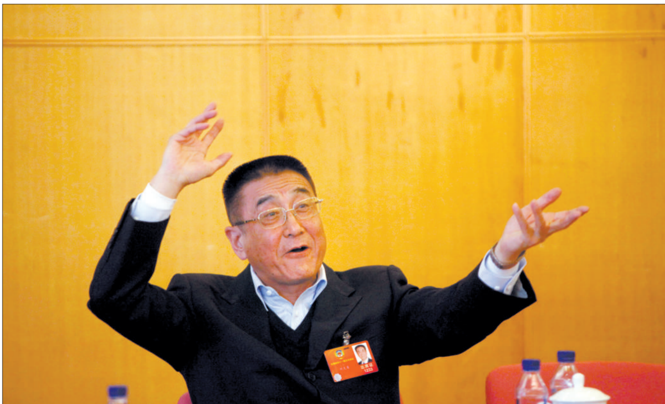
3月6日,北京会议中心,政协小组讨论会场,国家开发银行原副行长刘克茵发言时嗓门洪亮、手势丰富。

全国两会,来自各地区、各领域的代表委员们纷纷发表自己的想法和建议,积极地准备议案提案、建言献策。一点一滴,一言一词,推动社会进步,改善社稷民生。