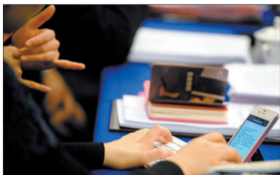
3月4日,文艺界小组讨论会。全国政协委员邵丽华通过手语和往手机上输入文字来参加小组讨论,和其他政协委员交流。