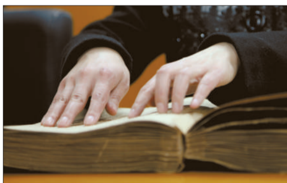
3月7日,全国政协委员、中科院研究生院教授杨佳在准备关于残疾人权益的提案。双目失明的杨佳委员希望通过提案为残疾人争取更多权益。