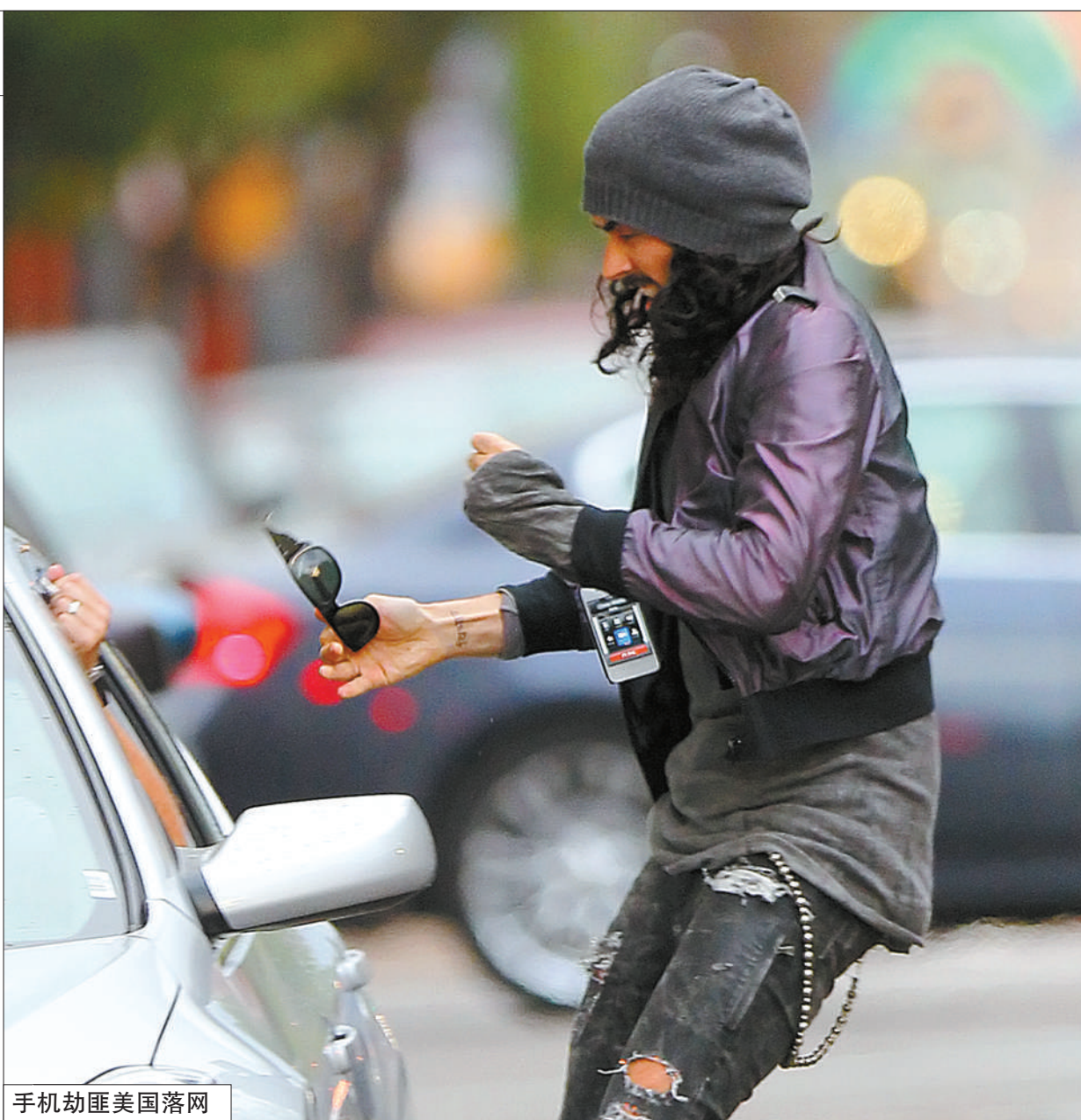
手机劫匪美国落网

3月12日，美国新奥尔良市，凯蒂·佩里前夫拉塞尔·布兰德怒夺偷拍记者手机，砸破一律师事务所窗户，致警方介入。