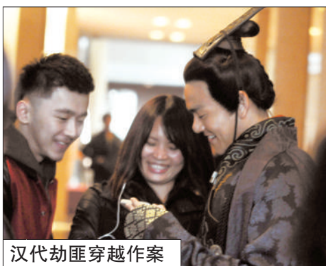
汉代劫匪穿越作案