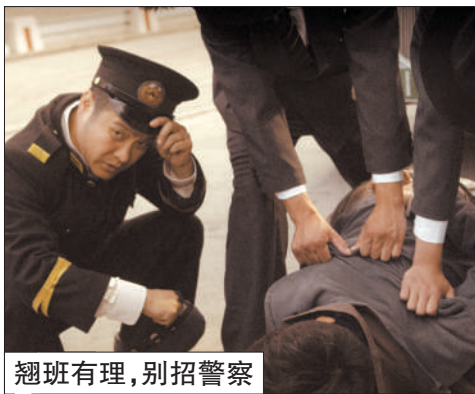
翘班有理，别招警察

日前，赵薇执导的电影《致我们终将逝去的青春》正在南京热拍，该剧组演员张瑶的助理因为翘班逛街误了事，怕被责骂，便谎称手机被抢。没想到张瑶让他马上报警，小伙子只好硬着头皮跟警方胡编了一些有关劫匪的外貌特点。南京玄武警方调查中发现蹊跷，当事人不但被拆穿谎言，还被拘留10天，罚款200元。