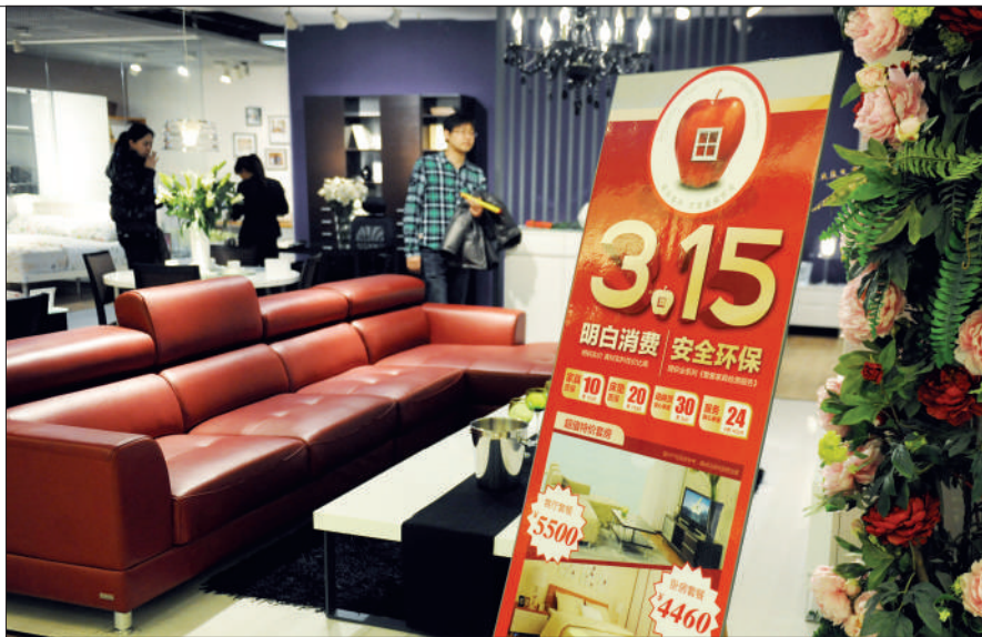
在本报调查中,家居消费中售后和家居产品使用问题也比较突出。