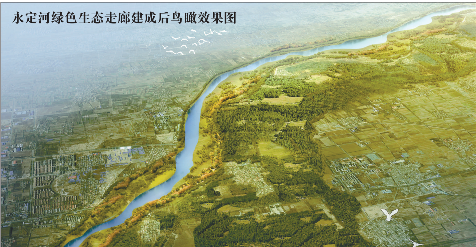
永定河绿色生态走廊建成后鸟瞰效果图

该地点距北京最美乡村——大兴区庞各庄镇梨花村1.6公里;距中国航天科普教育基地1.7公里;距龙熙顺景温泉度假酒店11公里;距庞各庄老宋瓜园14公里;距中国西瓜博物馆13公里;距北京最美乡村——大兴区榆垓镇西黄垓村10公里。