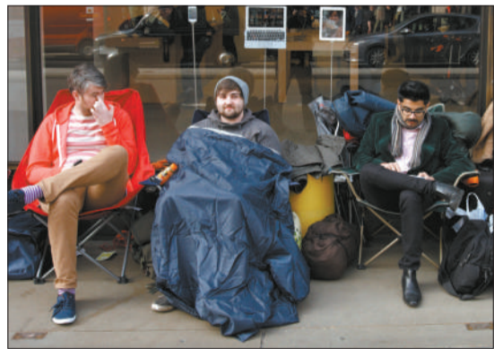
英国:果粉提前排队抢购苹果“新iPad”。图/CFP

本报讯 (记者林其玲实习生葛文婕) 苹果“新iPad”今天上午8点在美国、加拿大、英国、德国、法国、日本、新加坡、香港等11个国家或地区开始上架销售。中国大陆何时上货仍没有明确消息。 新iPad包括WiFi和4G两个版本,其中WiFi的16G版本为499美元。 上周与公众见面的“新iPad”市场评价不如预期。一些评论称其缺少颠覆性功能,多少让用户感到失望。