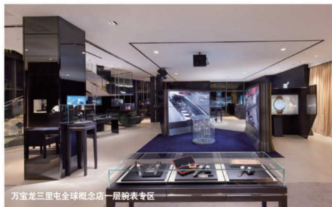
万宝龙三里屯全球概念店一层腕表专区

中国奢侈品消费者带来耳目一新的购物体验。万宝龙致力投入中国市场的决心是不容置疑的，也非常感谢中国市场为万宝龙品牌提供这样一个持续发展的机遇。在万宝龙三里屯概念店中，我们可以打造一个与中国消费者互动的交流平台，通过直接的体验，大家可以进一步了解万宝龙的产品故事和品牌理念。”