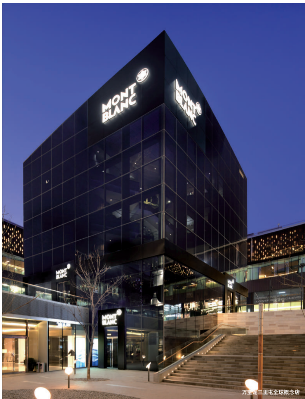
万宝龙三里屯全球概念店