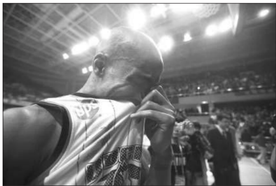
赛后 久违了,马布里为总决赛“尝鲜”动情落泪。