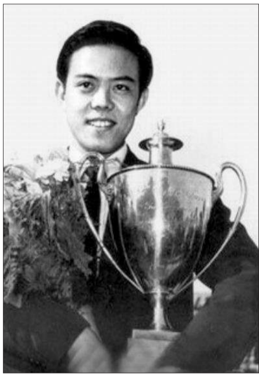
容国团(1959年世乒赛男单冠军)

53年前,到德国参加多特蒙德第25届世乒赛时,国乒队只是一支临时集训队,匈牙利队甚至用女队来和中国男队热身。53年过去了,国乒队再次兵发多特蒙德,出战本周日开始的第51届世乒赛团体赛,挟120.5个世乒赛冠军(中国选手与朝鲜选手曾合作获女双冠军),实力堪称乒乓球界的巴塞罗那。国乒的这份辉煌,不能忘记容国团,53年前,正是容国团在多特蒙德夺得了新中国第一个世界冠军——世乒赛男单冠军。在这个轮回里,国乒队赢了,但容国团输了。