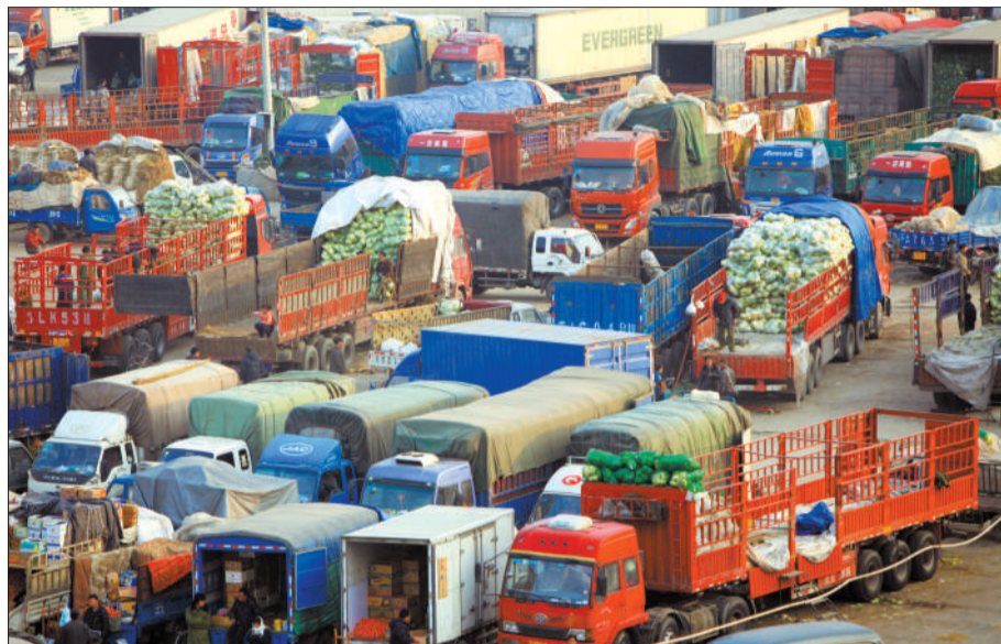
昨日,新发地批发市场内停放着大量运输蔬菜的卡车。

此外,各级价格主管部门将加大成品油市场监督检查力度,维护市场价格秩序,保证市场正常供应,维护成品油市场稳定。