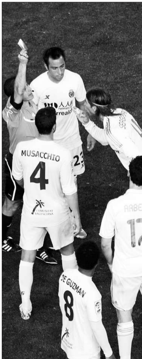
拉莫斯被罚下场时不停辩解。