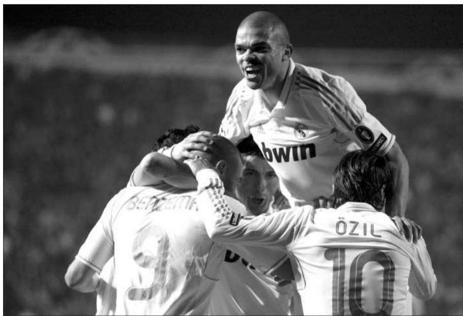
最后时刻连进三球取胜，皇马队员们抱在一起庆祝。

欧冠八强图中，希腊人竞技和本菲卡算得上不折不扣的黑马。然而在昨晨的1/4决赛首回合比赛中，两匹黑马在主场都现了原形，他们分别被皇马和切尔西斩落。在斩杀黑马的过程中，卡卡和托雷斯这两位复苏的昔日金童，为各自球队立下了赫赫战功。