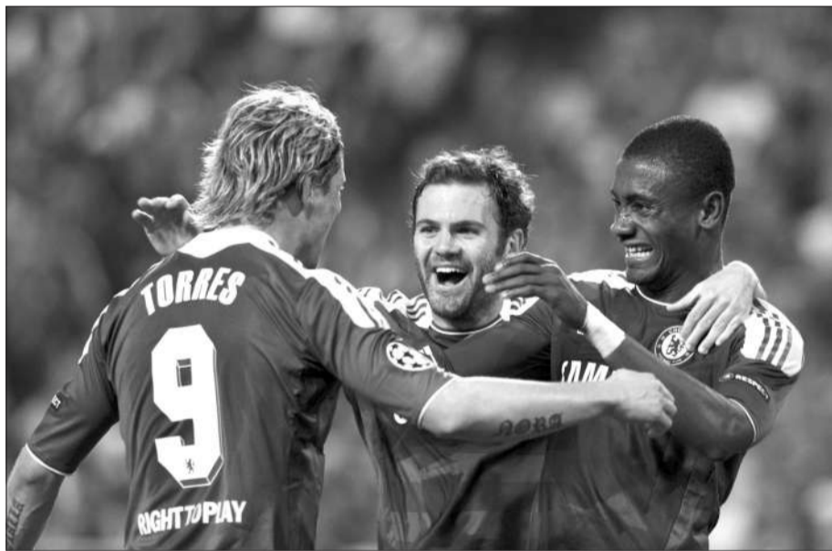
托雷斯虽然没有取得进球，但他的表现足以让切尔西球迷欢呼雀跃。