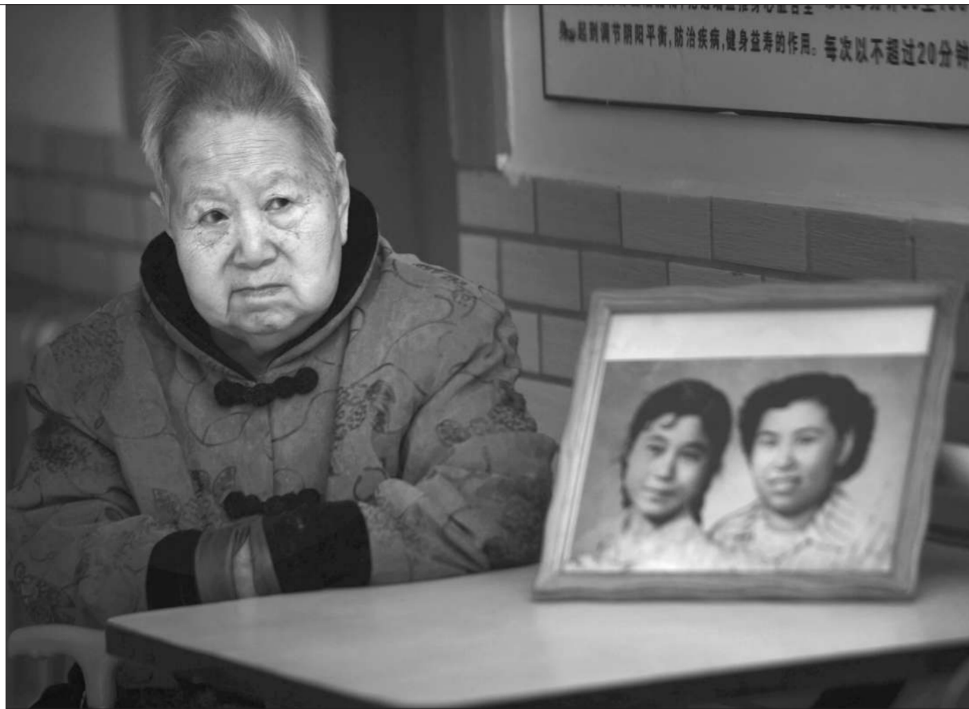
3月22日,北京一家养老院内,一位老太太坐在房间内,身前摆着年轻时的照片。