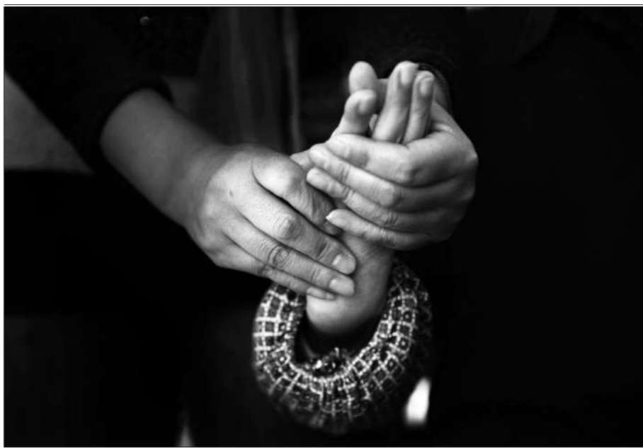
北京一社区养老院内,护工正在给老人按摩手。

政府建养老院,又盖房子、又搭屋,又添设备、又雇人,甚至提供运行经费。而民办一切都要靠自己,他怎么能竞争过你呢?你是零成本,挣一分钱都是挣。他挣十块钱都不够补偿的,长此以往民办养老机构必然举步维艰。