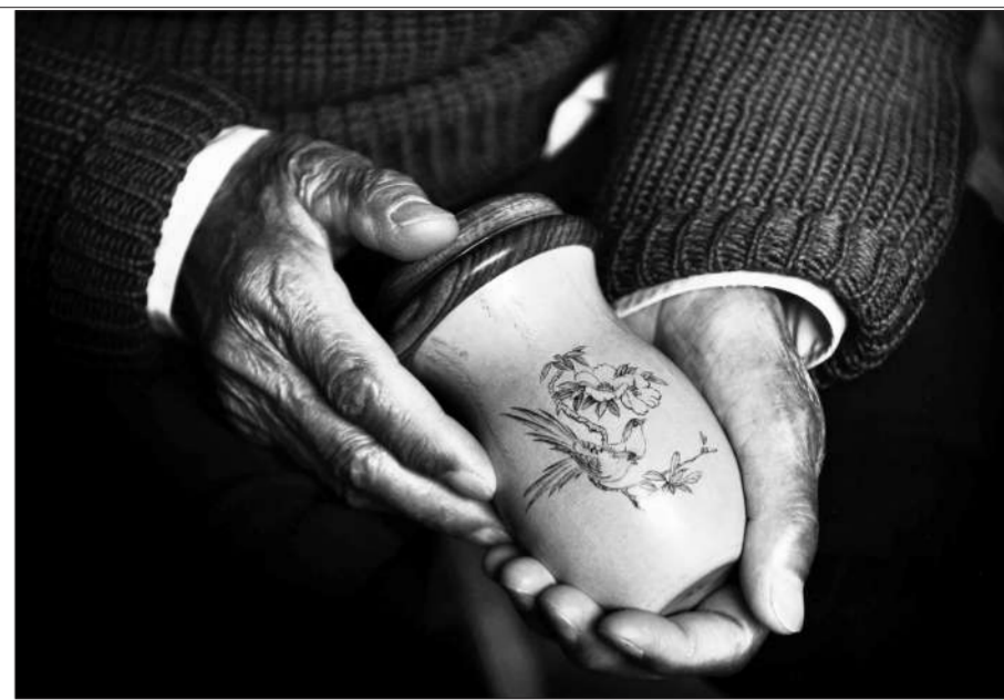
3月22日,养老院内的一名老人,捧着蝲蛄罐说这是他唯一的宝贝。