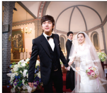
翻版《求婚大作战》加入了更多韩剧的细腻。