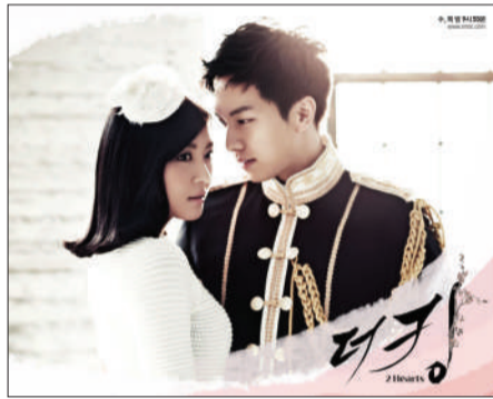
《王》延续了传统韩剧的轻松幽默戏路。

此剧一开播就取得了不俗的收视率，大牌主演加上豪华的配角阵容，以及与之相当的制作投入，让其成为焦点。现在《王》所需要担心的是，如何保持住这爆发性的优势，让自己能够始终保持领先，毕竟竞争对手《屋塔房王世子》和《赤道的男人》都来势汹汹。 □木星