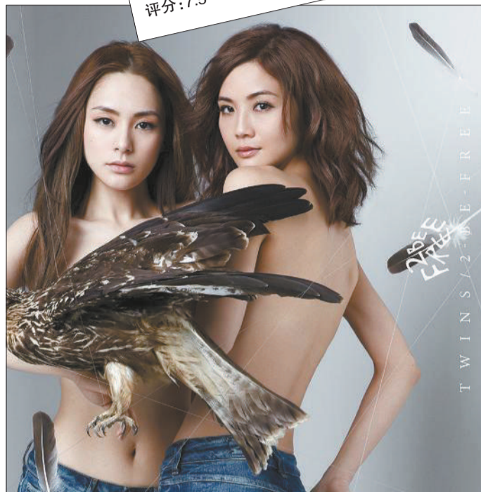
虽然封面上的阿娇和阿Sa在努力地扮着熟女,但还是掩盖不了她们比同龄女星成熟得慢了点的事实。

这是一支神奇的组合。Twins二人似乎只有绑在一起才能发挥她们的最大价值,一旦拆开,却陷入尴尬,这说明了当年英皇的慧眼,也是阿娇和阿Sa的尴尬之处。(也许起初的名字就奠定了两支组合的宿命,S.H.E当年“女生宿舍”的定位让她们即使毕业,大家也乐于看她们单飞,但Twins这对双生儿必须在一起才有看头。)不过,经历了各自不小的丑闻之后,两人依然能以少女形象出现而且毫无违和感,依然能高质量地再次打出一张纪念成长为题的回忆牌,也算是这支组合的奇妙之处了。