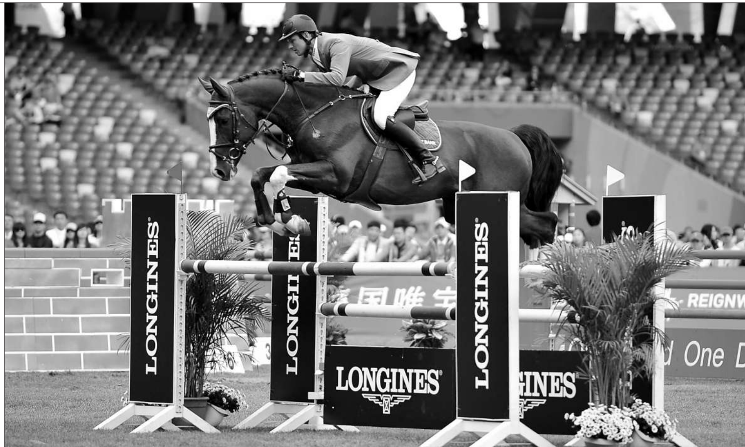
国际马术名将在北京鸟巢优雅跃马。