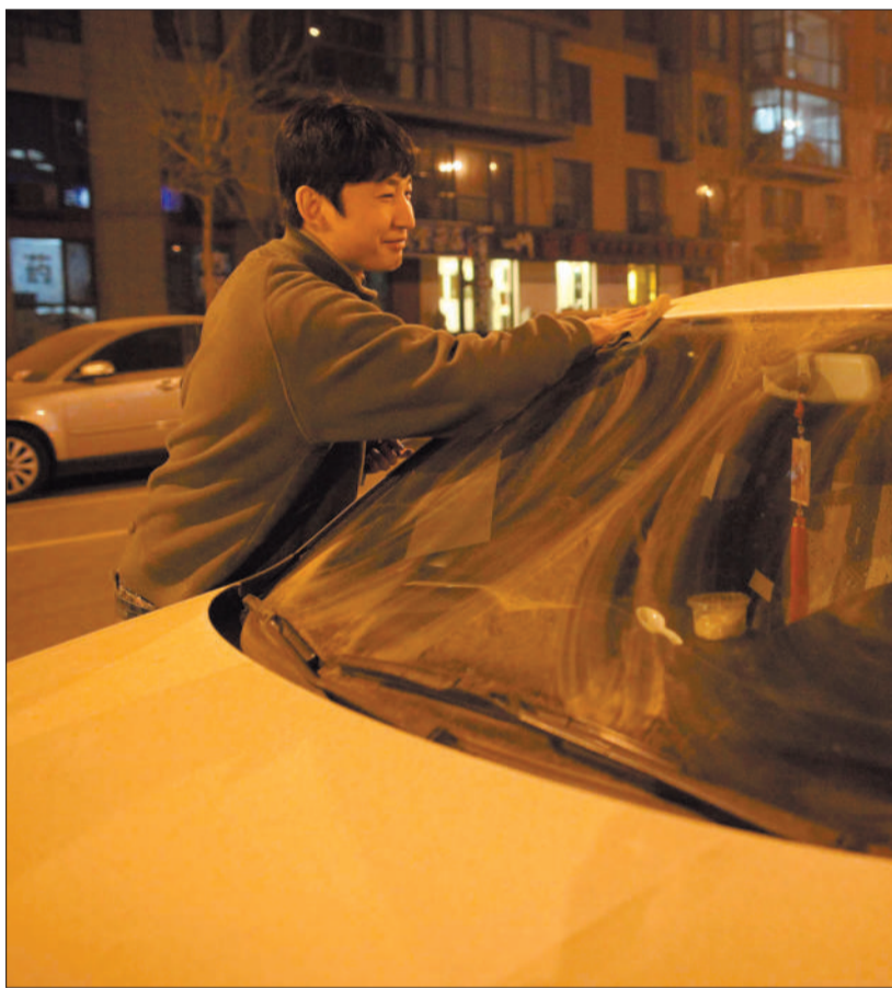
昨晚11时许,五棵松附近,一名车主在擦拭车上的沙尘。