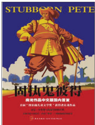
《固执鬼彼得》 作者：房龙 版本：新星出版社 2012年2月版 定价：28.00元