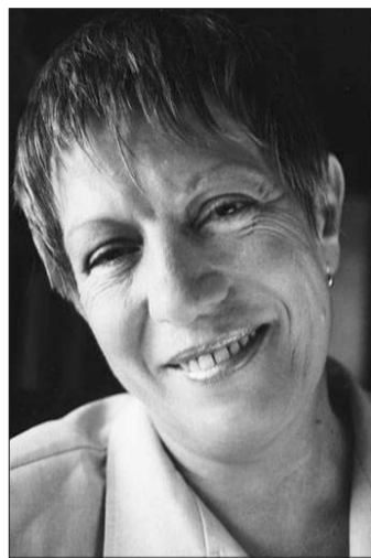
阿根廷著名 儿童文学作家安 德鲁埃托。

欧美媒体纷纷报道,2012年度的安徒生奖授予著名阿根廷女作家玛丽亚·特雷莎·安德鲁埃托(María Teresa Andruetto)。安徒生奖被称为“小诺贝尔奖”,是儿童文学领域里享誉最高的奖项。30年来,这位女作家一直投身于阿根廷青少年儿童文学创作,贡献巨大,完全无愧于这一殊荣。评委会认为,安德鲁埃托“擅长重要而新奇的作品写作,作品富有高度的艺术性。创作主题丰富多样,包