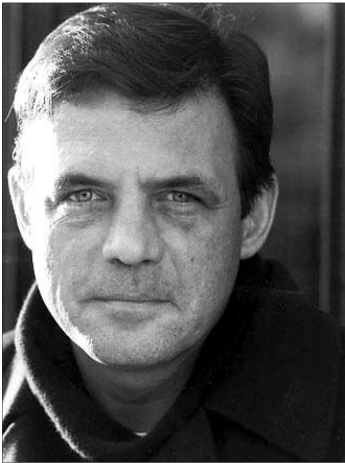
彼得·西斯 1949年生于捷克斯洛伐克,著名插画家,作品构图巧妙优美,故事精彩而寓意深刻,深受世界各国小朋友的喜爱。代表作有《玛德琳卡》、《生命之树》、《星际信使》等。