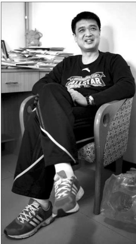
放松一下 闵鹿蕾接受采访时跷起了“二郎腿”。