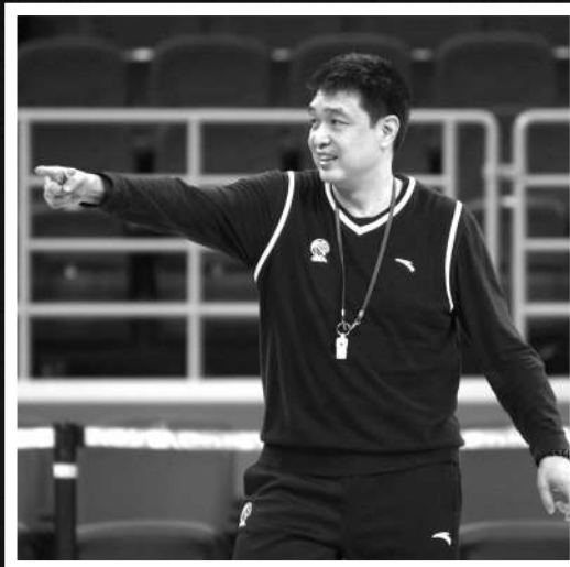
闵哨 球队训练中,鸣哨是“裁判”闵鹿蕾常干的活。