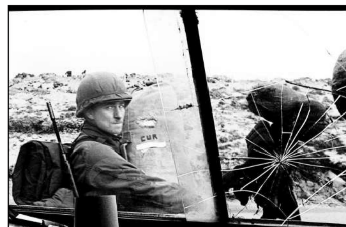
1982年4月13日,一名阿根廷士兵在军车里注视着窗外。