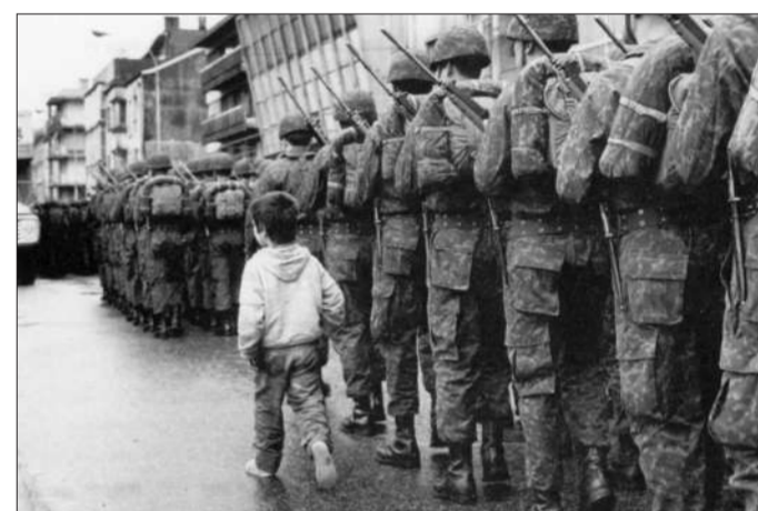
1982年4月,斯坦利港本地儿童经过阿根廷士兵身边。