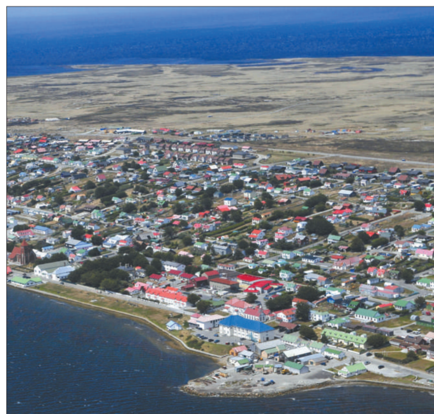
2012年1月26日,斯坦利港全景。

责编 颜颖颖 王晓枫 图编 李冬 倪华初 美编 俞丰俊 魏冬杰 责校 范锦春 杨许丽