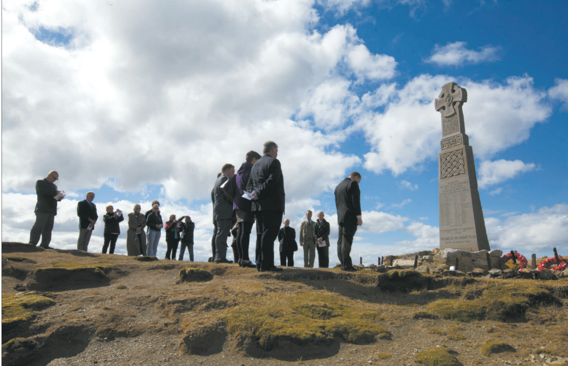
2007年,老兵们纪念马岛战争阵亡士兵。

如今30年过去了,静静的马岛波澜再起,据国际观察员表示,马岛周围蕴含丰富石油资源,英阿两国的争端远未休止,而这会否为本已伤痕累累的马岛增添新的伤痛呢? (天行)