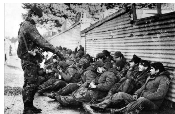
1982年,英国皇家海军正在看守阿根廷战俘。