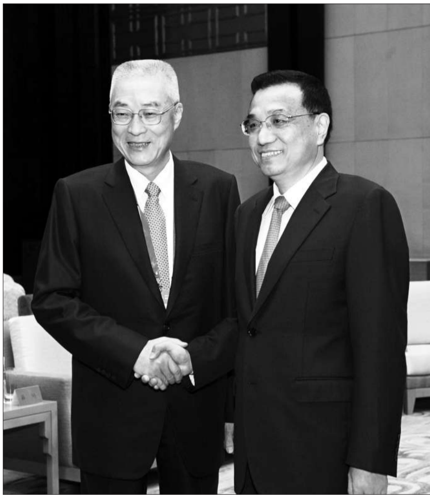
昨日，中共中央政治局常委、国务院副总理李克强在海南省博鳌会见台湾两岸共同市场基金会代表团名誉团长吴敦义一行。

他对这次会见双方就加快ECFA后续协商、建立两岸货币清算机制等一系列合作事项达成一致感到高兴，期望双方秉持求同存异、两岸和平、讲信修睦、民生优先的理念，进一步扩大交流，务实协商，加强合作，为两岸人民谋福祉，为中华民族谋繁荣，为炎黄子孙开盛世。