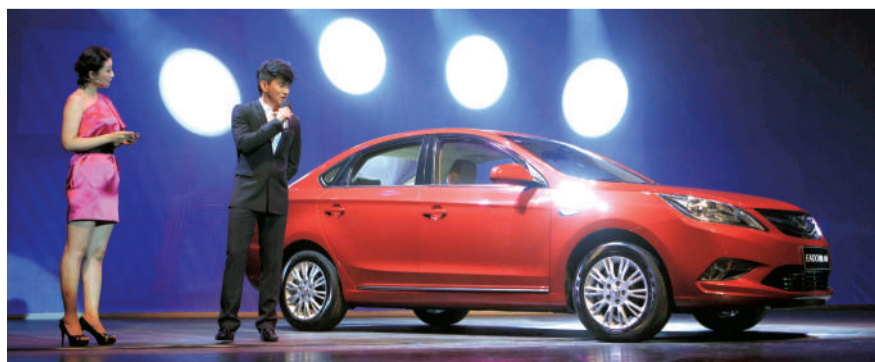
逸动采用了全新设计语言。