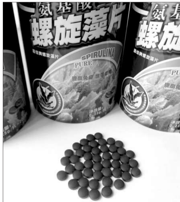
身陷铅超标门的汤臣倍健昨日复牌一度跌停。

昨日盘后数据显示，汤臣倍健收盘价51.59元/股，换手率14.50%，成交额48475万元，市值约112.83亿元，创业板市值排名第三。