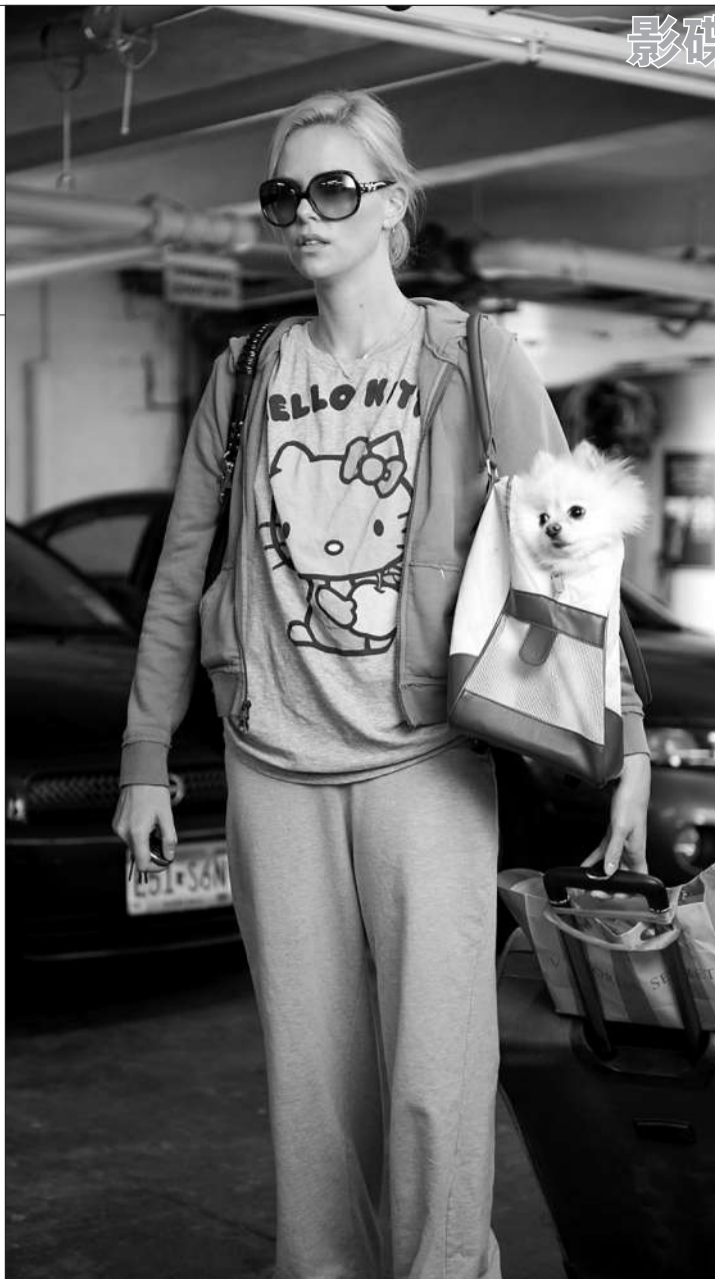
查理兹·塞隆试图以一个酒鬼角色突破惯有形象,但演技并未有太大突破。