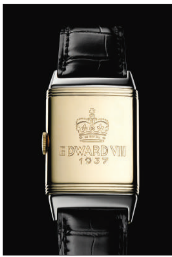
英国国王爱德华八世的积家 Reverso 腕表。

手表定制服务种类繁多,每个品牌都有其引以为豪的杀手锏。在积家的定制服务中,定制目录扮演了非常重要的角色,第一种是选择一款积家已有的 Reverso 表款,可以在有限的字体中指定镌刻的文字和数字,如果定制内容不复杂,则不需要送往日内瓦总部,三个月左右即可完成。第二种是指在已有表款背面添加珐琅、镶嵌和雕刻中任意两种或两种以上组合,图案仍然选自目录;第三种则是由顾客任意指定表盘背面的图案,并可以任意选择表现的工艺。伯爵则将自己顶级的珐琅彩绘工艺与陀飞轮相结合,提供“珐琅彩绘相对陀飞轮”专属定制服务,从彩绘工艺到宝石镶嵌,让顶级腕表藏家自定心目中的表款元