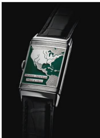
美国女飞行员阿梅莉亚·埃尔哈特定制的积家腕表。