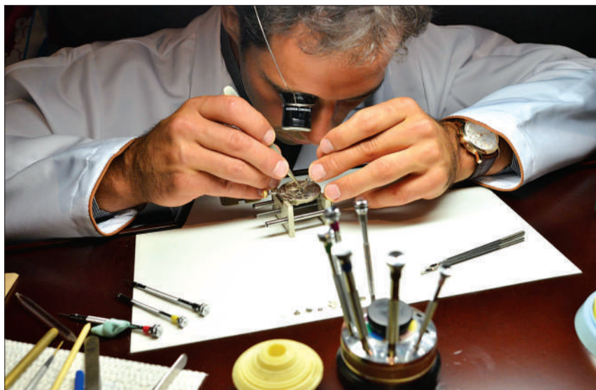
定制腕表的最后一个精工细作阶段常需要 6-8 个月。

至于江诗丹顿可以接受多高难度的定制服务,有一个实例可以证明:曾有位客人要求定制一个体积小且可带出门的复杂功能怀表,但它必须是世界第二复杂的怀表。因为在1989年百达翡丽推出的 calibre 89 具有 33 项功能,但是它的直径将近 90 毫米,可观的重量实在不适宜佩戴出门。因此江诗丹顿的这只怀表在轻便的同时还必须具备 24 到 28 种复杂功能。根据江诗丹顿的保证,这个被称作 Tivoli 的怀表定制计划将在 2013 年完成。