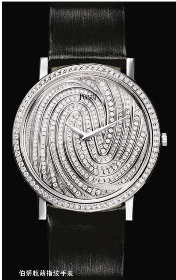
伯爵超薄指纹手表