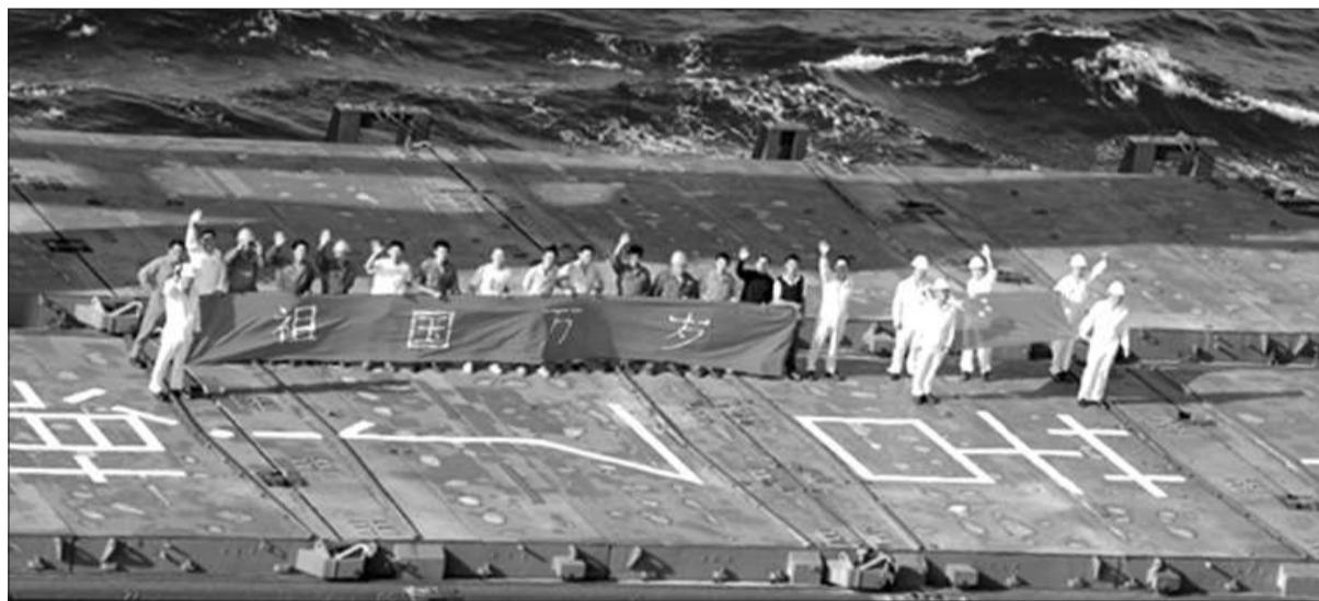
当地时间2011年12月13日上午,中国商船“祥华门”号在甲板上打出“祖国万岁”横幅和五星红旗。