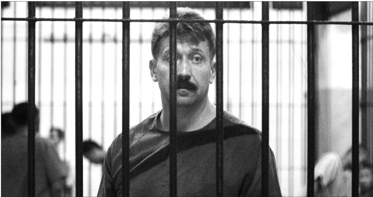
2008年12月22日,素有“死亡贩子”之称的布特身处美国的一个法院内。2012年4月5日,布特获刑。美国媒体未公布其在当日受审的新闻图片。