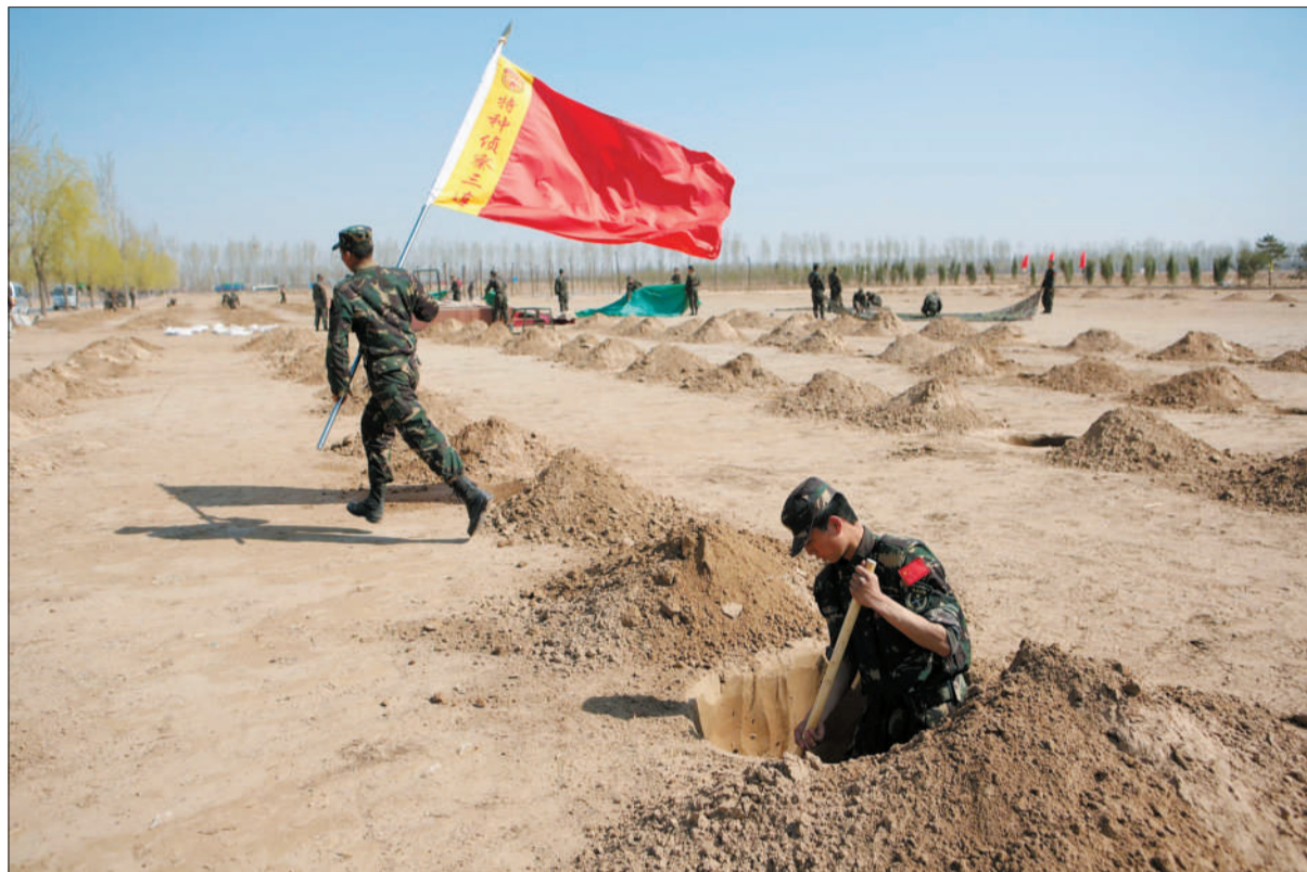
昨日,大兴福永路旁,一名士兵正在挖坑,树坑有半人深。近日,部队士兵在此处挖坑、种树。

战士们说,他们一边挖一边用锹把丈量坑的深度、直径,做到每个坑基本都是直径1米、深80厘米,像用圆规画过,而挖出来的土都会被拍得四方四方。