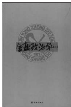
《金庸政治学》 叶克飞著 译林出版社 2012年3月

叶克飞就是这么个指东挖西的人，让他读史，他偏给你讲笑话，让他读武侠，他偏给你深挖政治，又能以自己的独特悟性，道出你看到的却想不到的东西，表面上似乎是走火入魔了，实际上却是开创了新的门派——歪读门。立派宗旨就是：把书读歪了，也是一种乐！