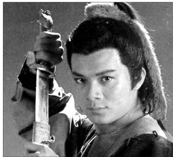
●郭靖 史上最强投资者

书中，郭靖从一个天赋极差的孩子变成人人敬仰的大侠，是一个苦逼青年的励志故事。他练就绝学，又是东邪的女婿、老顽童周伯通的结拜兄弟，履历丰厚，人脉广。他的“仕途”经历，是一个成功投资的过程。叶克飞分析，一个人有了实力还不够，还得胸怀天下，不能整天为了鸡毛蒜皮的事情计较，该吃点亏的时候必须吃亏，做大侠还需像郭靖一样德才兼备。