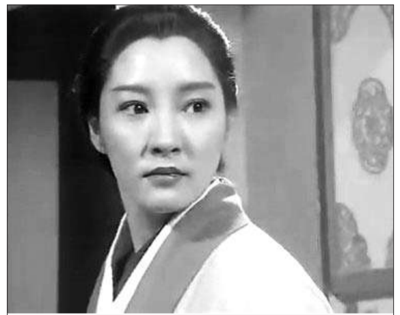
●李莫愁 性情中人怒辞职

书中，郭靖从一个天赋极差的孩子变成人人敬仰的大侠，是一个苦逼青年的励志故事。他练就绝学，又是东邪的女婿、老顽童周伯通的结拜兄弟，履历丰厚，人脉广。他的“仕途”经历，是一个成功投资的过程。叶克飞分析，一个人有了实力还不够，还得胸怀天下，不能整天为了鸡毛蒜皮的事情计较，该吃点亏的时候必须吃亏，做大侠还需像郭靖一样德才兼备。