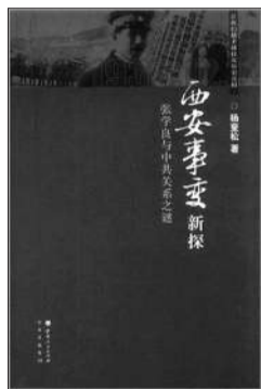
《西安事变新探》 杨奎松 著 山西人民出版社 2012年3月