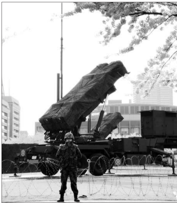
9日,东京,日本自卫队员站在“爱国者3”导弹发射设备前。