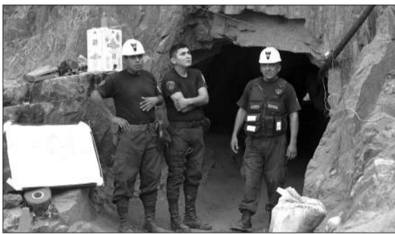
6日，伊卡省“黑头”铜矿，救援人员正在日夜赶工搜救(上)。8日，警方守在塌方矿井洞口(下)。