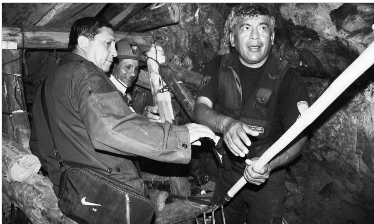
7日，秘鲁南部伊卡省，救援人员在塌方的“黑头”铜矿场内搜救被困工人。