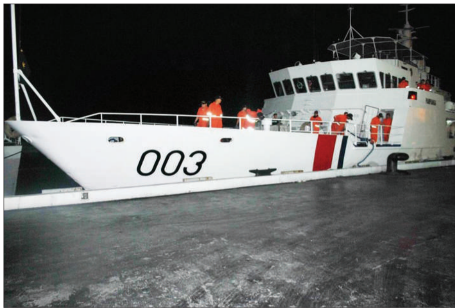
菲律宾海岸警卫队发布的照片,显示海警船正准备驶离马尼拉港。

岸警卫队派出一艘56米长的搜救船已在12日下午抵达黄岩岛海域。菲军方北吕宋司令部司令阿尔坎塔拉对媒体表示,菲律宾海岸警卫队船只前往黄岩岛海域是为了“降低”海军在“海上执法”中发挥的作用。他早前曾向媒体表示,菲海岸警卫队将从海军方面接手处理该事件,以“缓和局势”,并把这起事件列为“海上警务案件”处理。