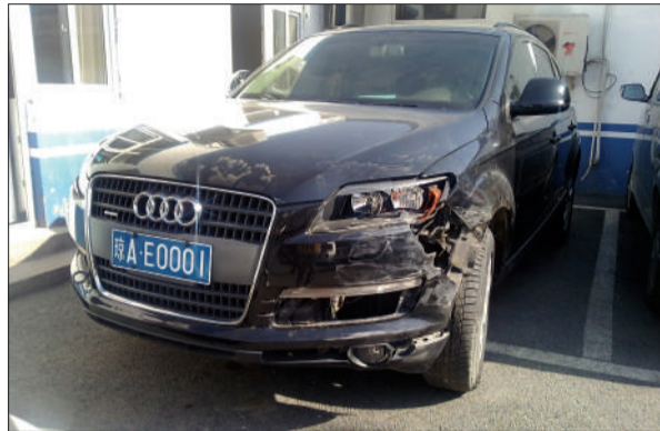
昨日下午，昌平西府派出所，事件中涉及的夏利车及奥迪Q7停在院内。新京报记者 易方兴 摄