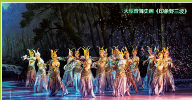
大型音舞史画《印象野三坡》