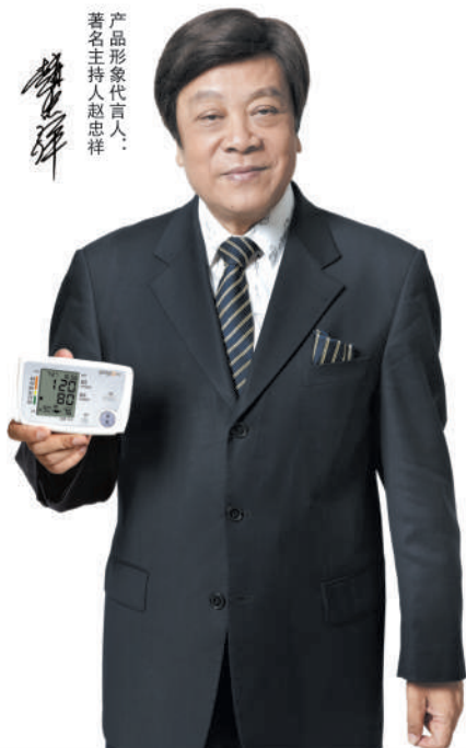
产品形象代言人： 著名主持人赵忠祥