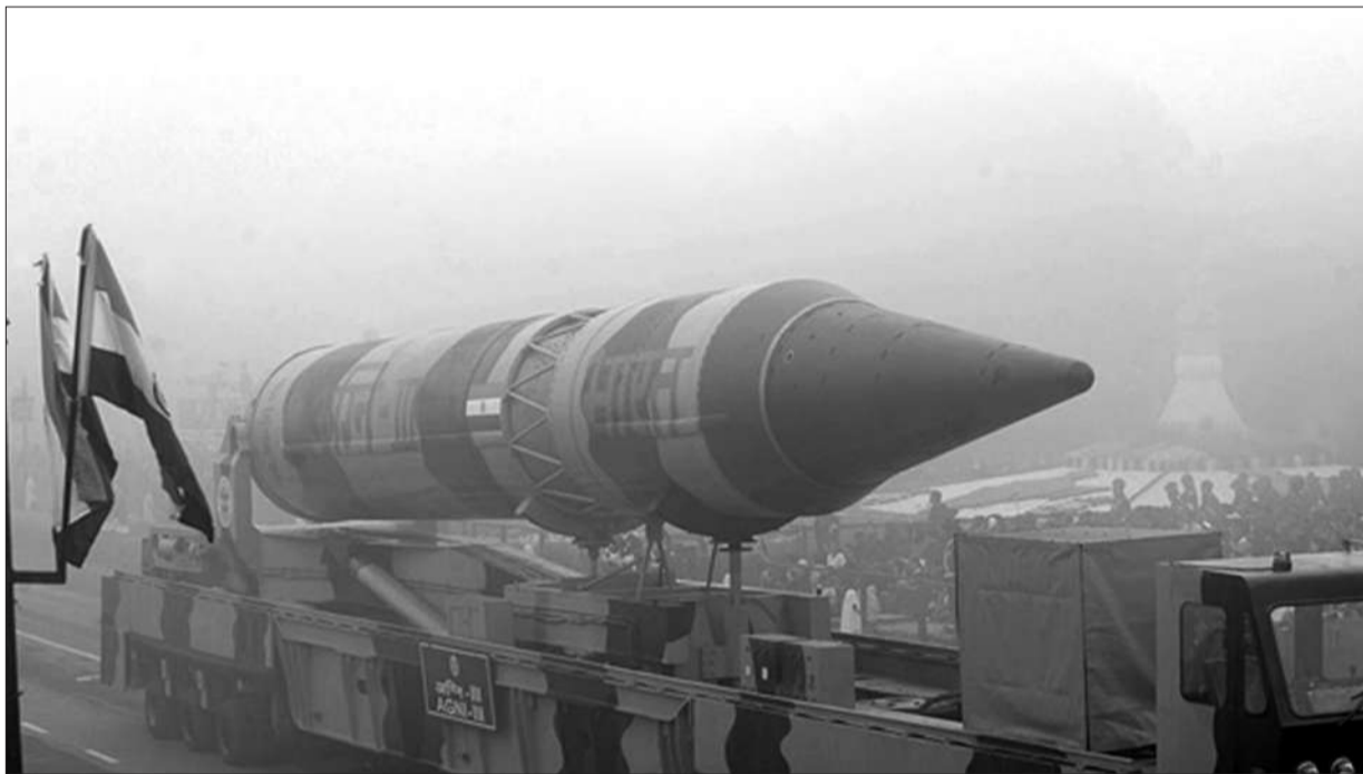
印度展示国产“烈火3”战略导弹。

国防研究与发展组织的总控制师阿维纳什·钱德尔称,“烈火5”的技术可以改变战略格局。尽管导弹的制造过程最主要的挑战是确保飞行中的精确性,并使导弹头能够承受重入大气层时大约5000摄氏度的高温。