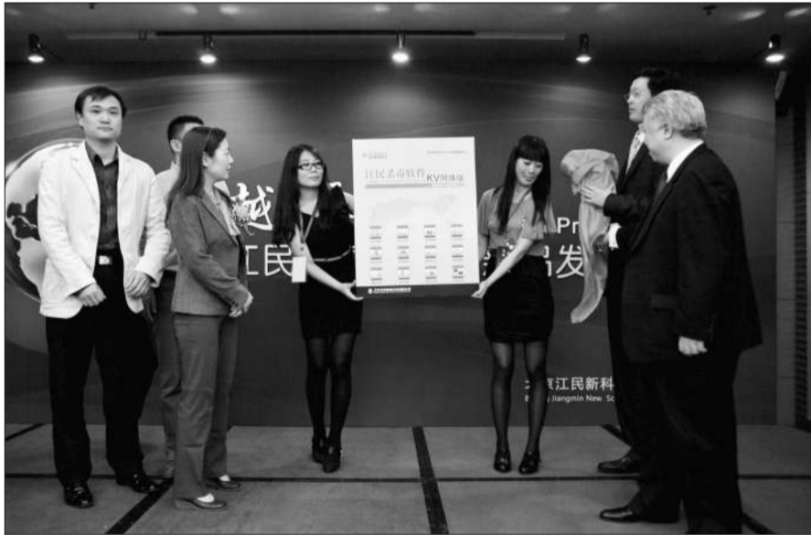
昨日,江民科技嘉宾为新款杀毒软件揭牌。当天,江民重回安全市场。

艾睿琪表示,此次事件可能导致150万个账户受到影响,其中有95%—97%是美国的。VISA近期已大幅提升确保支付卡交易安全的能力,改进后相当于防欺诈能力比2009年提高了29%,其中对高风险交易的欺诈检测率比此前提高了122%。